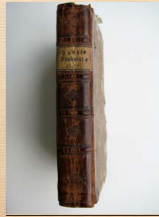
“Tā pirmā pavāru grāmata” 1795. gada izdevums.