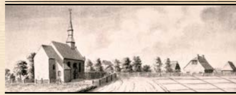
Skats uz Rubenes baznīcu K. Hardera darbības laikā, 1799. gadā. (J. K. Broce. Zīmējumi un apraksti. 3. sējums, 393. lpp.)