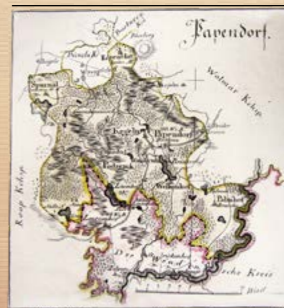
Rubenes draudze ap 1795. gadu. L. A. Mellina zīmēta karte.