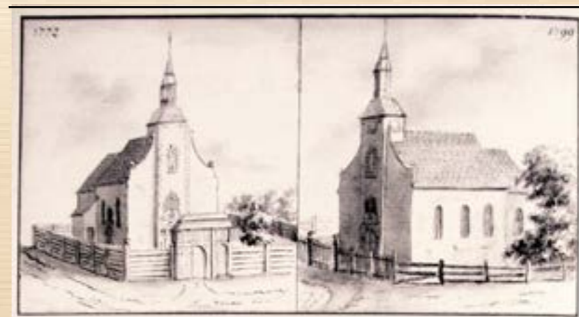
Rubenes baznīca – pa kreisi 1772. gadā, pa labi – 1799. gadā. (J. K. Broce. Zīmējumi un apraksti. 3. sējums, 392. lpp.)